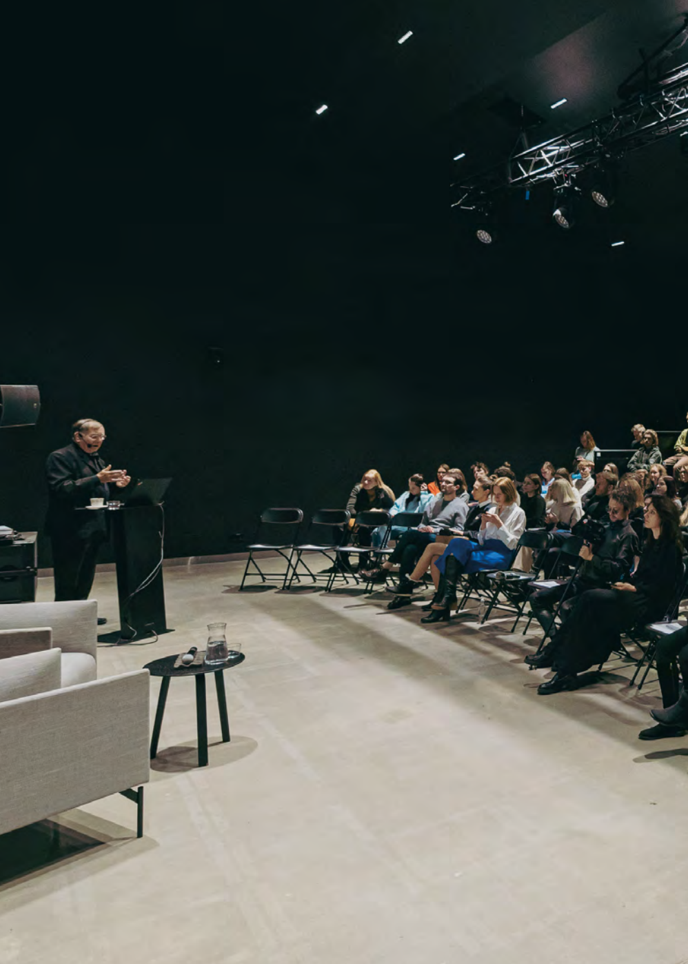
Conferencia, Vilna, Lituania, 2023.