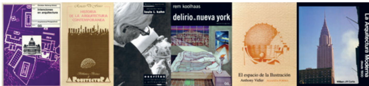
[Fig. 2] Portadas de traducciones realizadas por Jorge Sainz Avia.