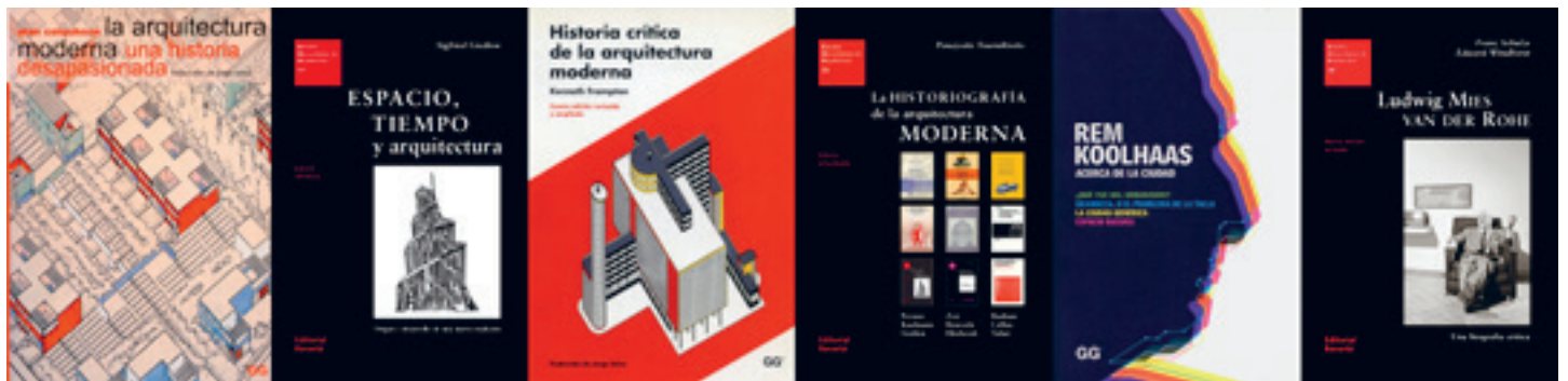
[Fig. 4] Portadas de traducciones realizadas por Jorge Sainz Avia.