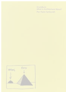
Pier Paolo Tamburelli Grundkurs MACK, Londres, 2023 232 páginas; 35 euros