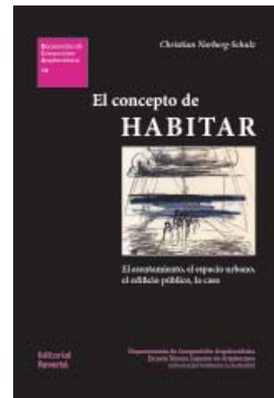
Christian Norberg-Schulz El concepto de habitar Reverté, Barcelona, 2023 192 páginas; 30 euros

THERE ARE ways to tackle the history of architecture, and what Pearman offers is ‘high middlebrow.’ A former architecture critic of the Sunday Times , Pearman demonstrates in this publication the very British ability to make the complex simple and use language with clarity, and reach out to audiences that may not exactly be demanding or discriminating, but are interested in the theme. On the other hand, this practical attitude, another English virtue, results in an ‘essential guide’ where 55 buildings in history, classified by typology, are described in some detail and illustrated with photos galore. The book might be of interest to the general public, but maybe not to this magazine’s readers.