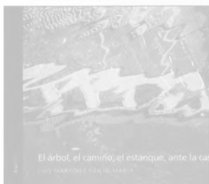
EL ÁRBOL, EL CAMINO, EL ESTANQUE, ANTE LA CASA Luis Martínez Santa-María Fundación Caja de Arquitectos/2004 Texto en castellano/206 págs.

Arquitectos, artistas y diseñadores se aíanan hoy en día en la búsqueda de una legitimidad para su trabajo, así como en actividades de relevancia social. La revistas profesionales llaman a la reflexión y reconsideración de cómo se lleva a cabo la profesión. En otras palabras, el debate sobre una nueva forma de compromiso a través del diseño y las disciplinas visuales encaminadas hacia los problemas actuales de la sociedad, está claramente sobre el tapete. Como contribución a este debate, el libro reúne una interesante colección de artículos de los principales autores que sacaron a la luz este 'nuevo compromiso'.