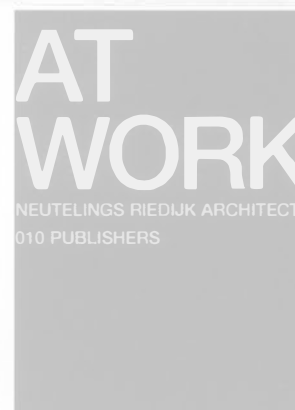
AT WORK. NEUTELINGS RIEDIJK ARCHITECTS 010 Publishers/Rotterdam, 2003 Texto en inglés/399 págs.

Una de las maneras más provechosas de entender la relación entre la construcción y el proyecto es examinar la evolución de los materiales y las maneras de construir a lo largo de la historia. En este libro se estudian los acontecimientos y los avances que, en el ámbito de la industria de la construcción, han alterado el proceso de realización de los edificios y provocado cambios en la composición y en la imagen de las construcciones. A lo largo del texto se analiza cómo todo ello también ha conducido a ciertos cambios en el diseño arquitectónico y cómo, en definitiva, ha modificado la actitud de los proyectistas y las características de las teorías acerca del proyecto.