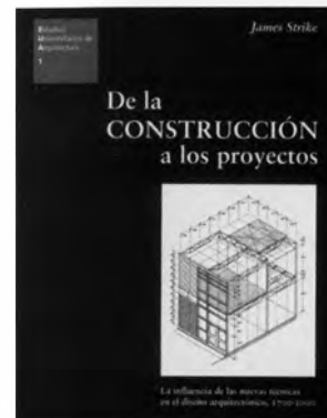
DE LA CONSTRUCCIÓN A LOS PROYECTOS James Strike Editorial Reverté/Barcelona, 2004 Texto en castellano/229 págs.

Si bien el espacio no tiene sexo, su valoración se hace a través de quien hace uso de él; el espacio no es neutral y denota quién y cómo lo ocupa, y estar relacionado con el poder económico, político y cultural.