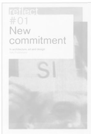
NEW COMMITMENT Nai Publishers/Rotterdam, 2003 Texto en inglés/199 págs.

Arquitectos, artistas y diseñadores se aíanan hoy en día en la búsqueda de una legitimidad para su trabajo, así como en actividades de relevancia social. La revistas profesionales llaman a la reflexión y reconsideración de cómo se lleva a cabo la profesión. En otras palabras, el debate sobre una nueva forma de compromiso a través del diseño y las disciplinas visuales encaminadas hacia los problemas actuales de la sociedad, está claramente sobre el tapete. Como contribución a este debate, el libro reúne una interesante colección de artículos de los principales autores que sacaron a la luz este 'nuevo compromiso'.