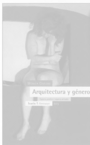
ARQUITECTURA Y GÉNERO Mónica Cevedio Icaria Editorial/Barcelona, 2003 Texto en castellano/102 págs.

Además, este libro recoge, con textos e imágenes, una visión completa de la planificación y arquitectura de estos muelles portuarios del este, acompañado de varios ensayos por distintos especialistas. Asimismo ofrece una visión comprensiva de la vivienda holandesa a lo largo de estas últimas décadas.