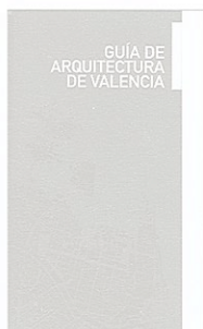
GUÍA DE ARQUITECTURA DE VALENCIA AA.VV.

Este libro está dirigido específicamente a los arquitectos, a los estudiantes y a los promotores, aunque puede ser de un gran interés para un amplio espectro de lectores interesados en las energías renovables. El Código Técnico de la Edificación obliga a la inclusión de sistemas fotovoltaicos en determinados tipos de inmuebles. Las oficinas y los usos comercial, administrativo, hotelero y hospitalario deben incorporar en su proyecto cierta cantidad de potencia fotovoltaica que estará en función de su superficie.