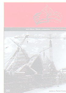
JORN UTZON. OBRAS Y PROYECTOS Jaime J. Ferrer Forés

Guía de arquitectura de la ciudad de Valencia, que viene a unirse a la importante cantidad de ciudades que cuentan con una publicación de este tipo y que, como es bastante común, ha sido realizada y editada por el Colegio de Arquitectos mediante un amplio equipo de investigadores y de redactores de los textos. La guía abarca la historia completa de la ciudad y está precedida por el prólogo "La ciudad en su historia". Como es usual, los edificios ocupan un espacio mayor o menor según la importancia que se les conceda. Contiene plano.