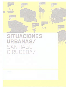
SITUACIONES URBANAS Santiago Cirugeda

En el libro se recogen 44 ejemplos de viviendas unifamiliares españolas, junto con las opiniones de los arquitectos autores. Son propuestas diversas en sus requisitos y situación geográfica, que proporcionan una visión del quehacer de profesionales preocupados por hacer compatibles la sostenibilidad y la arquitectura de calidad. Nos ofrecen soluciones a los diferentes climas de la península; propuestas donde aparecen materiales naturales y también novedosos; construcción ligera y pesada, inercia térmica, invernaderos, etc. Algunas apuestan por las energías limpias y otras son viviendas industrializadas construidas en seco.