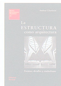
LA ESTRUCTURA COMO ARQUITECTURA Andrew Charleston

Edición de la obra de Utzon en libro de bolsillo según la colección de carácter internacional que publica en España la editorial catalana. Textos en castellano e inglés. El contenido es una recopilación muy completa de la obra del maestro danés, editada con los medios gráficos modestos que pertenecen a la colección pero con una gran cantidad de información literaria y, sobre todo, gráfica. Se divide en los capítulos La esencia de la arquitectura , Plataformas y mesetas: ideas de un arquitecto danés y Arquitectura aditiva .