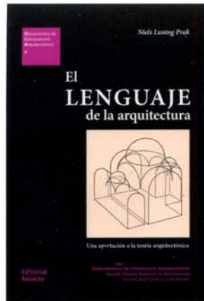
EL LENGUAJE DE LA ARQUITECTURA Una aportación a la teoría arquitectónica Niels Luning Prak Editorial Reverté, 2018 Texto en español/260 págs.

Es fundamentalmente la nueva relación sujeto-objeto, la nueva posición —en sentido literal y metafórico— del hombre perceptor respecto al objeto percibido y los nuevos procedimientos formales a que esto da lugar lo que constituye el objeto de este libro. Entre estos principios formales nuevos se cuentan la deformación expresiva y la planitud, la multiplicidad de visiones y la fragmentación y descomposición elemental, el análisis del movimiento y el tiempo como nueva dimensión, el cuestionamiento de la centralidad y de la jerarquía, la visión diagonal frente a la frontalidad, la equivalencia de direcciones en el espacio y el equilibrio inestable, la destrucción de la caja espacial, la eliminación de los límites y la interpenetración, la desmaterialización y la disolución de los cuerpos y la emancipación de la luz como material plástico.