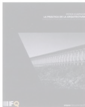
PETER ZUMTHOR LA PRACTICA DE LA ARQUITECTURA Dirigido por Michael Blackwood Colección Arquia / Documental 37 Fundación Arquia, 2018 Texto en español/65 págs.