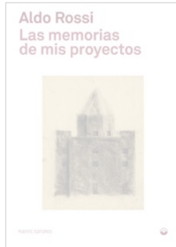
Aldo Rossi Las memorias de mis proyectos Puente Editores, Barcelona, 2024 192 páginas; 23,90 euros

FAR FROM forming a constellation of satellites in orbit around planets named Le Corbusier or Mies, the Modern Movement was a vast, varied galaxy that is hard to properly take stock of. Doing so with the gaze of a historian writing from the prism of architecture is a great achievement of Kenneth Frampton, a nonagenarian whose desire to unveil 'the other modernity,' the one not necessarily linked to functionalism, is the pillar of this book. Eighteen chapters look at that number of works by nineteen authors tackling different scales, intentions, contexts, and material cultures, resulting in a kaleidoscope of The Other Modern Movement. The foreword is by Luis Fernández-Galiano.