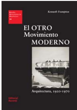
Kenneth Frampton El otro Movimiento Moderno Reverté, Barcelona, 2023 424 páginas; 40 euros

Lejos de tomar la forma de una constelación de satélites que orbitan en torno a planetas con el nombre de Le Corbusier o Mies, el Movimiento Moderno fue más bien una galaxia compleja y vasta de cuya variedad cuesta dar cuenta con rigor. Conseguirlo desde la mirada del historiador que contempla y escribe desde la arquitectura, es uno de los méritos fundamentales de Kenneth Frampton, autor ya nonagenario cuya voluntad por desvelar 'otra modernidad' no necesariamente ligada al funcionalismo sostiene este libro. Distribuido en dieciocho capítulos, el volumen glosa otras tantas obras de diecinueve autores que recogen escalas, intenciones, contextos y culturas materiales distintas para acabar componiendo una suerte de aproximativo caleidoscopio de 'lo moderno otro'. El libro se enriquece con un prólogo de Luis Fernández-Galiano.