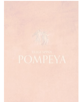
Luigi Spina Pompeya La Fábrica, Madrid, 2023 480 páginas; 150 euros